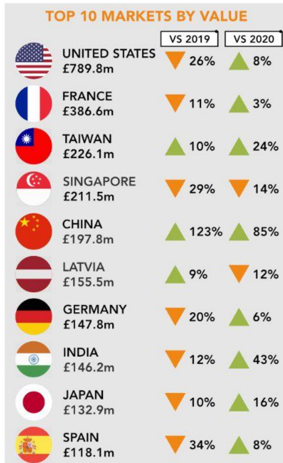
蘇格蘭威士忌十大出口市場

中國整體市場不斷發展，部分酒廠升幅尤其明顯，這個為威士忌投資提供黃金機會，也反映出留意市場資訊，以及各地市場價差的重要性。