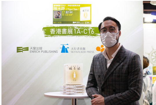
參加2021年書展的簽書會，與讀者直接交流