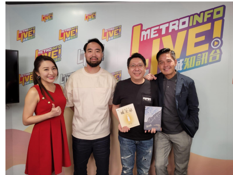
新城知訊台節目「鄭伽班」分享威士忌投資入門