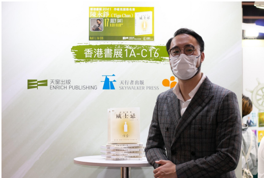
參加2021年書展的簽書會，與讀者直接交流