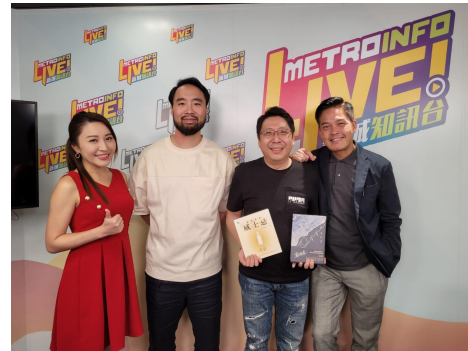
新城知訊台節目「鄭伽班」分享威士忌投資入門